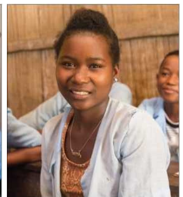
4 neue Schulen werden für 200 Schüler gebaut. Die Schulen haben fließend Wasser, Toiletten und die volle Ausstattung.