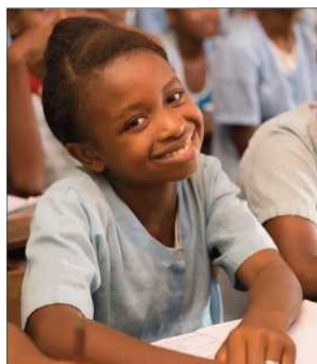
Mehr als 20.000 Mädchen werden durch das Programm erreicht.