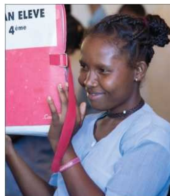
600 Kinder profitieren von Aufholklassen, um in das normale Schulsystem reintegriert zu werden.